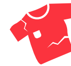
Sirang mga damit