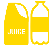
Mga bote at sisidlang yari sa plastik