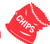
Plastica morbida (o portare nel bidone REDcycle)