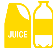
Bottiglie e contenitori di plastica