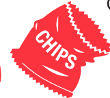
Plastiques souples (On peut aussi les déposer dans un bac REDcycle)