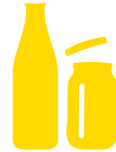
Chai và bình thủy tinh